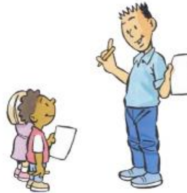
1. IK DOE HET VOOR