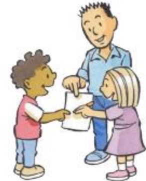
2. WIJ DOEN HET SAMEN