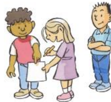
3. JULLIE DOEN HET SAMEN