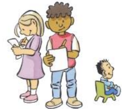
4. JIJ DOET HET ZELF